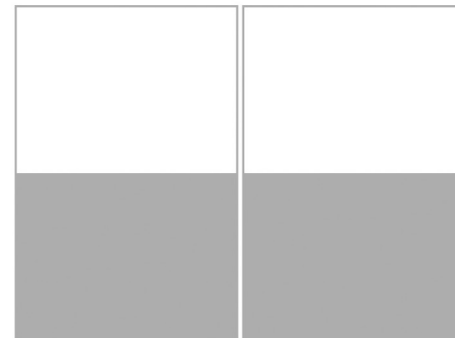
Doppia mezza pagina